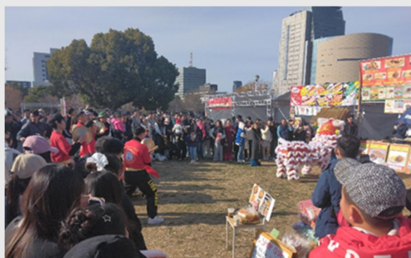
【大規模催事】 『ベトナムテト祭り』の様子 (2025年1月4日(土)、1月5日(日))