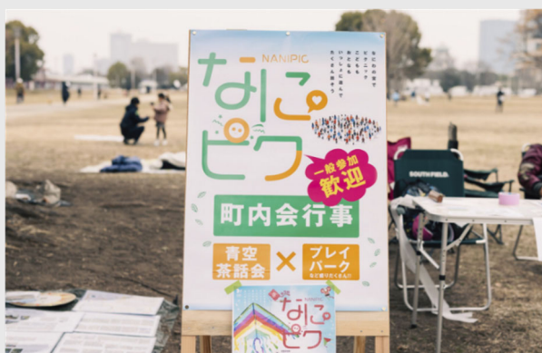
【なにサポ】 『なにピク』(町内会行事) (2025年3月29日(土))