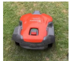
芝刈りロボットイメージ