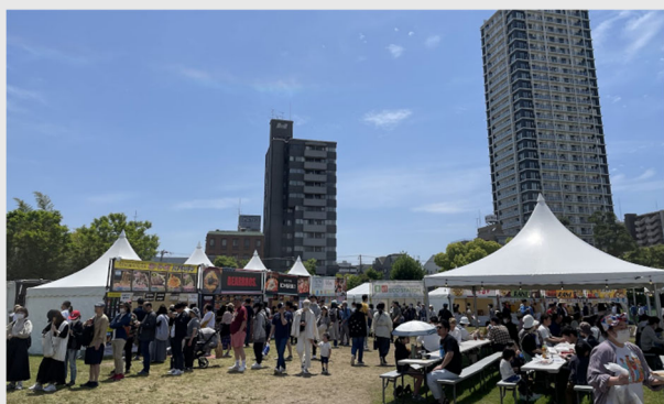
【大規模催事】 『NANIWANOMIYA WORLD KITCHEN FEST.』の様子 (2023年4月29日(土)～5月7日(日))

また、2023年度から難波宮跡（南部ブロック）において、難波宮の情報発信や賑わい創出を目的に実施してきた魅力向上業務（大規模催事・市民と連携した活動『なにサポ』※5（さまざまな市民活動を育み・サポートする取り組み）も発展させるかたちで継続実施します。