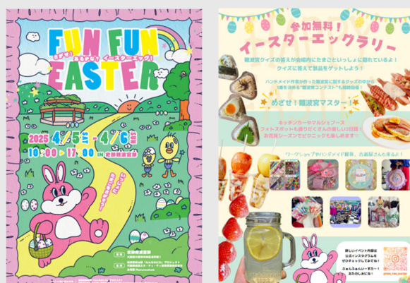
【大規模催事】 『さがせ！あるかな？イースターエッグ！FUN FUN EASTER』 (2025年4月5日(土)、4月6日(日))